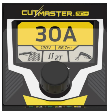
Enkel och intuitiv TFT LCD-panel